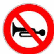
Figura II 51 Art. 116

Vieta di superare la velocità indicata in km/ora, salvo limiti inferiori imposti a particolari categorie di veicoli.