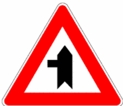
Figura II 43/c Art. 112

Presegnala un'intersezione a "T" con una strada subordinata che si immette dalla destra.