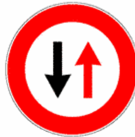
Figura II 41 Art. 110

Presegnala una intersezione in cui vige la regola generale di dare la precedenza a destra.