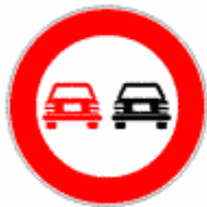
Figura II 48 Art. 116

Vieta di entrare in una strada accessibile invece dall'altra parte, in quanto a senso unico.