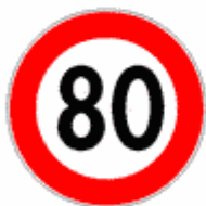
Figura II 50 Art. 116

Vieta di seguire il veicolo che precede ad una distanza inferiore a quella indicata in metri sul segnale.