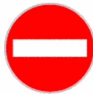
Figura II 47 Art. 116

Vieta di entrare in una strada sulla quale è vietata la circolazione nei due sensi.