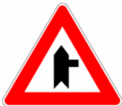
Figure II.43/b, II.43/c, II.43/d Art. 112