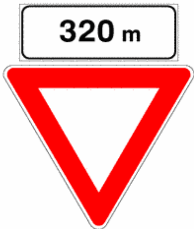
Figura II 38 Art. 108

Indica l'obbligo di fermarsi in corrispondenza della striscia trasversale di arresto e dare la precedenza prima di inoltrarsi nell'area della intersezione.