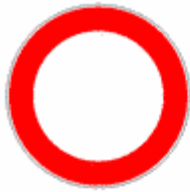
Figura II 46 Art. 116

Vieta di entrare in una strada sulla quale è vietata la circolazione nei due sensi.