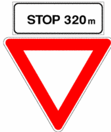
Figura II 39 Art. 108

Presegnala la successiva presenza di un segnale DARE PRECEDENZA, indicando anche la distanza dall'intersezione.