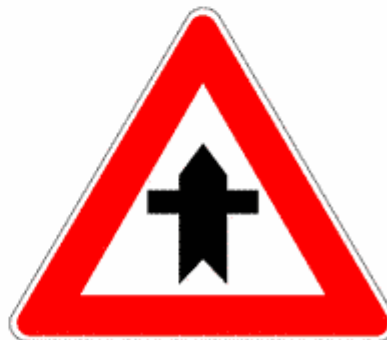
Figura II 43/a Art.112

Indica che la strada non gode più del diritto di precedenza.