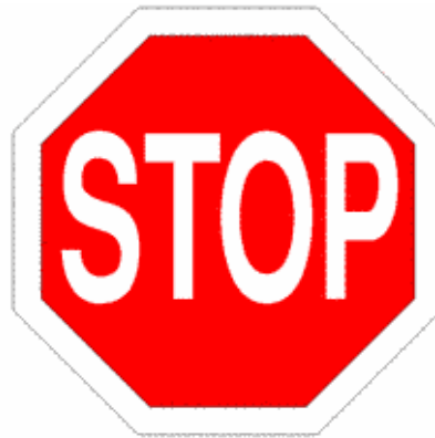
Figura II 37 Art. 107

Indica l'obbligo di dare la precedenza ai veicoli che circolano nei due sensi sulla strada sulla quale ci si immette o che si va ad attraversare.