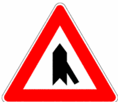
Figura II 43/d Art. 112

Presegnala un'intersezione a "T" con una strada subordinata che si immette dalla sinistra.