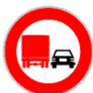
Figura II 52 Art. 117

Vieta, salvo casi di pericolo immediato, l'uso di avvisatori acustici.