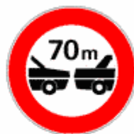
Figura II 49 Art. 116

Vieta di sorpassare i veicoli a motore, eccetto i ciclomotori e i motocicli, anche se la manovra può compiersi entro la semicarreggiata con o senza striscia continua.