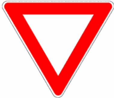
Figura II 36 Art. 106

Figure II.36 Art. 106 - II.37 Art. 107 - II.38, II.39 Art. 108