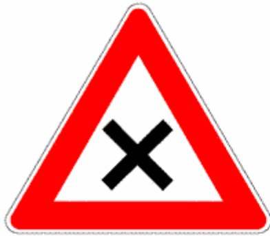
Figura II 40 Art. 109

Figure II.40 Art. 109 - II.41 Art. 110 - II.42 Art. 111 - II.43/a Art. 112