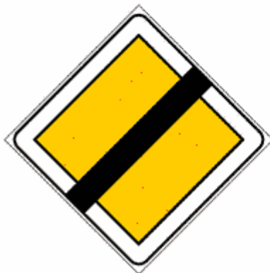
Figura II 42 Art. 111

Indica l'obbligo di dare la precedenza alla corrente di traffico proveniente in senso inverso, nelle strettoie nelle quali è stato istituito il senso unico alternato.